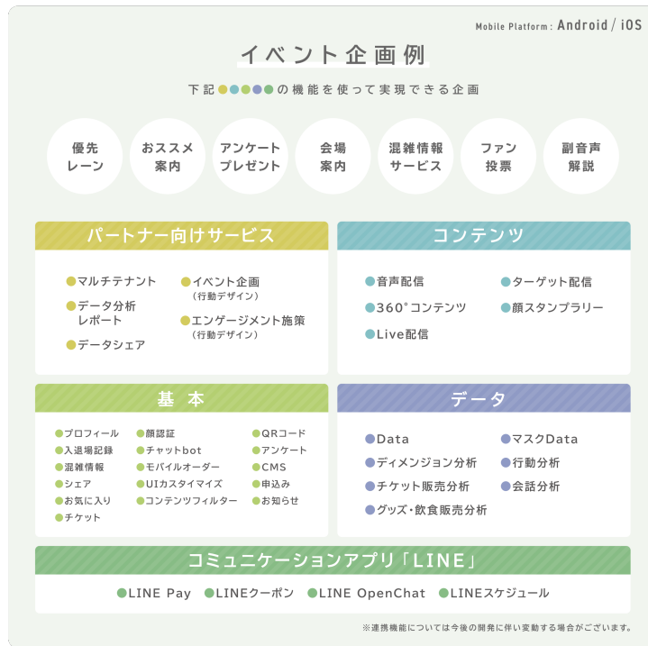
本サービス利用で実現できるイベント事例

また、本サービスでは従来のセールスマーケティングと異なる次世代マーケティングデータベースの開発にも取り組んで参ります。心理学をベースに消費者を深く理解し、共感性やマッチングの高いサービスを継続的に開発することで、消費者が満足し幸せを感じられるマーケティングの実現を目指しております。